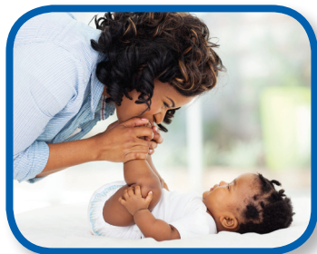
Baby Feet 0-3 months