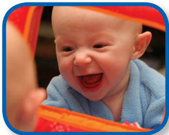
¿Quién es ese? De 3 a 8 meses