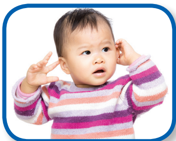
Ojos, orejas, nariz y boca De 6 a 12 meses