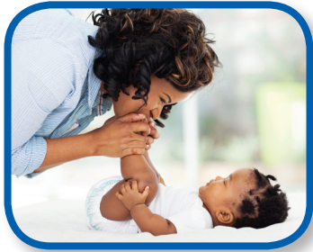
Los pies del bebé De 0 a 3 meses