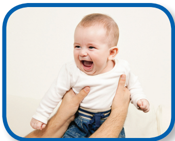
Mira mi cara De 3 a 8 meses